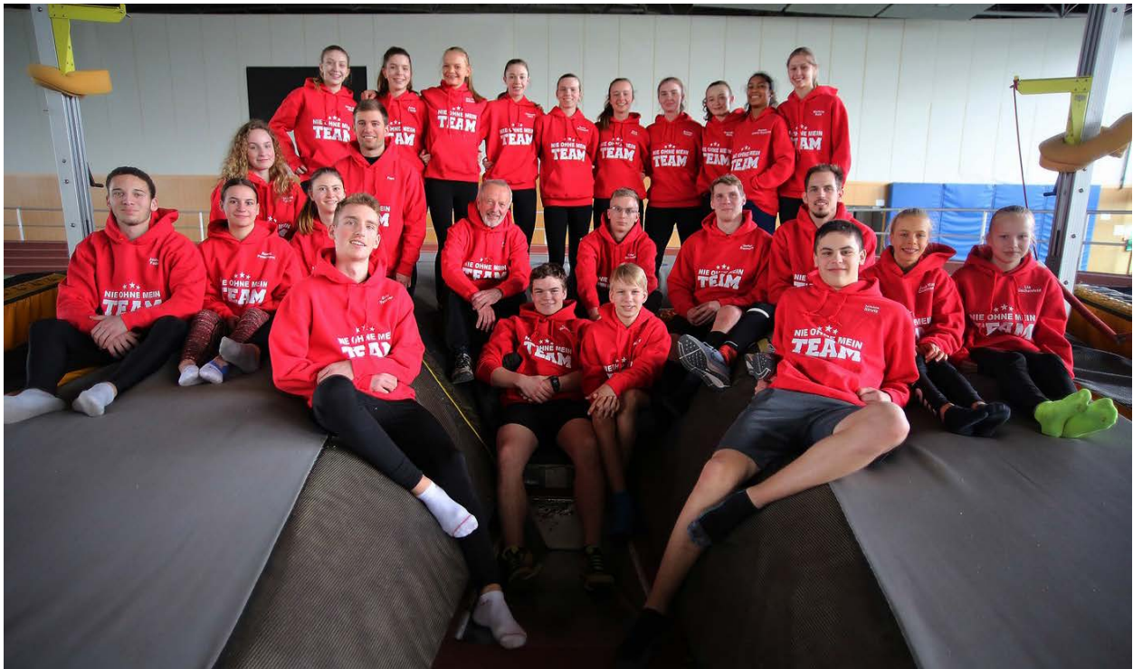
Trainingslager 2018 in Potsdam mit neuem Outfit

Besonders erfreulich für die Leichtathletikabteilung ist zudem das Engagement der Firma Remmert, die uns tatkräftig unterstützt. Die Firma und die Familie Remmert haben dafür gesorgt, dass wir uns mittlerweile auch in Bezug auf eine einheitliche Sportkleidung gut präsentieren können (siehe Foto unten).