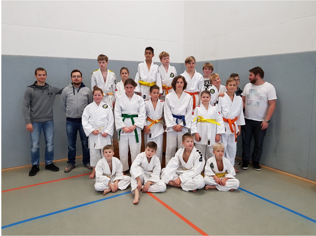
Kämpfer und Betreuer beim letzten Turnier im November 2018